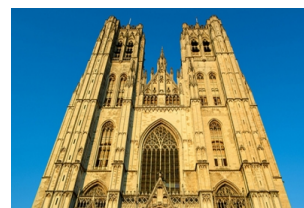
圣米歇尔及圣古都勒大教堂