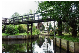
施普雷河自然保护区