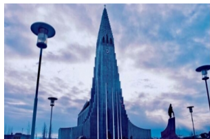
哈尔格林姆斯教堂