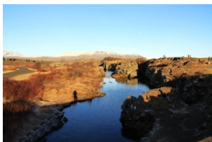
冰岛古议会旧址(露天议会)