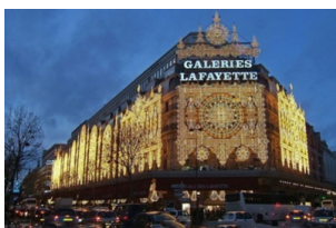
老佛爷百货公司（奥斯曼旗舰店）