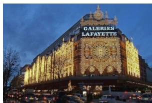
老佛爷百货公司（奥斯曼旗舰店）