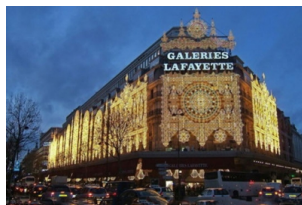
老佛爷百货公司（奥斯曼旗舰店）