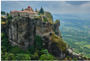
梅黛奥拉天空之城

（注：6座修道院的开放时间各不相同，视当天情况选择可以参观的修道院，一般参观2座修道院。修道院有严格的着装规定，女性穿裙子。如果没有裙子，修道院门口提供围裙可以借用，请在入场前借一条。）