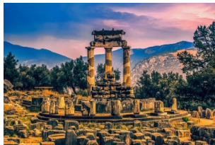
德尔菲遗址和博物馆

早餐后，驱车前往号称“世界肚脐”、“地球中心”的圣地——德尔菲，参观【德尔菲遗址和博物馆】，宙斯的双头鹰相聚于此，阿波罗在此建立，漫步在山头山下，满是古希腊的荣光。途中游览有“小瑞士”之称的【阿拉霍瓦(Arachova)小镇】，徜徉在阿拉霍瓦宁静弯曲的小巷中，头上的雪山云雾缭绕，让人恍惚间仿佛来到了瑞士。当晚入住卡兰巴卡酒店。