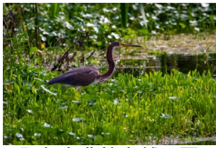
阿尔布费拉自然公园