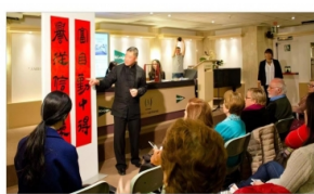
华夏文化学习中心