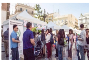
孔子学院合作单位