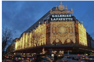
老佛爷百货公司（奥斯曼旗舰店）