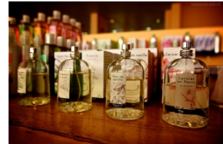
巴黎花宫娜香水工厂