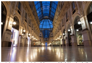
埃马努埃莱二世拱廊桥