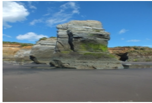
The three sister