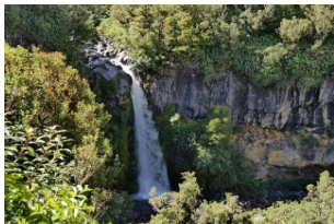
艾格蒙特国家公园

，到达半山腰的道森瀑布游客中心，在布满青苔的森林步道内进行一个小时的漫步，探访由火山顶雪水汇集而成的道森瀑布，在林间寻找橘色的小蘑菇。如果天气晴好，一定要登上游客中心洗手间后边的瞭望台，可以清晰的看见东边的塔斯曼海，以及西边新西兰北岛中心的鲁阿佩胡大火山。壮观的景色一定令你赞叹。下午打卡半岛最西边的艾格蒙特角灯塔，倚靠着灯塔和大火山合影，保留令人难忘的时刻。傍晚回到新普利茅斯。