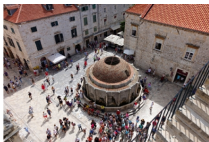
弗朗西斯科修道院