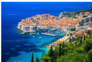
杜布罗夫尼克城墙