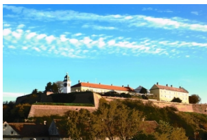
彼德罗瓦拉丁堡垒

早餐后前往塞尔维亚第二大城市诺维萨德，来到多瑙河右岸，登上【彼得罗瓦拉丁要塞】俯瞰多瑙河及城市全景。随后参观老城区中心的【自由广场】及其附近的【市政厅】和【天主教堂】。最后回到布达佩斯结束行程。