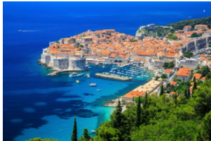
杜布罗夫尼克城墙

酒店出发前往杜布罗夫尼克老城，欣赏【方济会修道院】和【杜布罗夫尼克城墙】，乘坐游船畅游亚得里亚海，遥望老城全景和美丽的【Banje海滩】，当晚入住杜布罗夫尼克或其周边酒店。