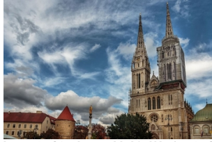
圣母升天大教堂（萨格勒布大教堂）