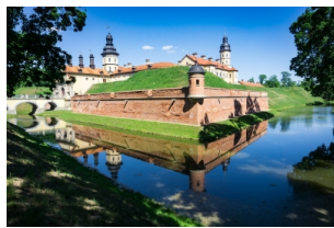
拉济维乌家族城堡建筑群