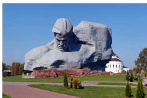
布列斯特要塞纪念碑