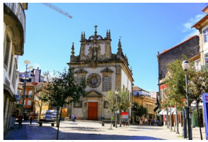
布拉加共和国广场