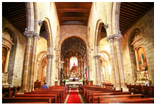
奥利维拉圣母教堂