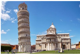
比萨斜塔及其周边

早餐后游览徐志摩笔下的翡冷翠---佛罗伦萨，参观【圣母百花大教堂】（外观）和【领主广场】。佛罗伦萨位于意大利的托斯卡纳区，亚平宁山脉中段西麓盆地中，以美术工艺品著称。之后前往比萨游览【比萨斜塔】（外观），还有中世纪地中海海运都市繁盛时代的建筑物，而这些纪念性建筑群集的大教堂广场则被称为【奇迹广场】，给人的感觉迥然不同于意大利其他都市的广场，那散布着白色大理石的历史建筑物，洋溢着明朗、轻快的气息。当晚入住比萨或其周边酒店。