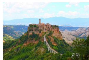
"天空之城"白露里治奥