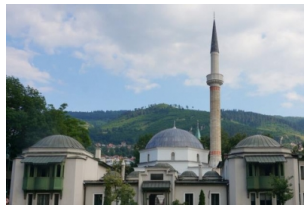
萨拉热窝大清真寺