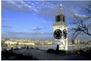
彼得罗瓦拉丁要塞

注：本网页内所标注时间均为参考时间，实际抵达时间会因各种不可抗力原因如天气，堵车，交通意外，节日赛事，骚乱罢工等有晚点可能，请您谅解。您如有后续行程安排需搭乘其他交通工具前往其他城市，我们强烈建议您至少预留3小时以上的空余时间，以免行程延迟受阻为您带来不便。由于您没有预留足够的空余时间而导致的自行安排行程有所损失，我公司概不负责，敬请谅解。