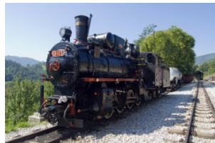
Sargan 8 铁路