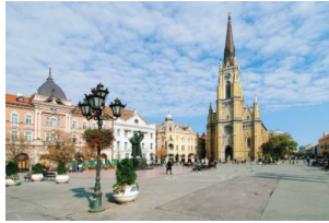
诺维萨德自由广场