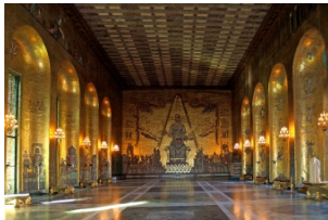
斯德哥尔摩市政厅---诺贝尔晚宴会场

早上游轮到达斯德哥尔摩，位于梅拉伦湖畔的【斯德哥尔摩市政厅】远远望去就似一艘在海中行驶的邮轮。而【斯德哥尔摩老城】又是另一番景色，斑驳的教堂，狭窄的鹅卵石小路，配合着飘散在空气中浓浓的咖啡香，漫步在老城区，你会感觉到，仿佛时间都放慢了脚步。傍晚乘坐游轮返回赫尔辛基。