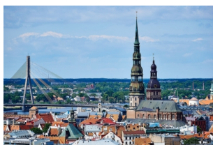
美女如云的地方【里加】：邂逅一段故事