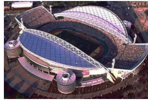
巴塞罗那奥林匹克体育场