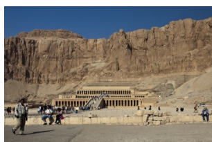
哈特普苏特女王神庙