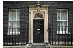
唐宁街10号英国首相府官邸