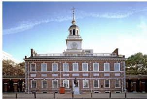
费城国家独立历史公园