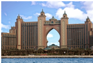
棕榈岛亚特兰蒂斯酒店