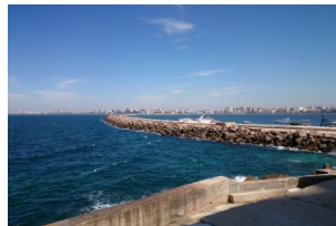
亚历山大一日游（自费）