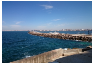
亚历山大一日游（自费）