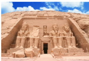
阿布辛贝大小神殿

上午您可以选择在游轮上好好地休息或是游玩阿斯旺城，我们更加推荐您参观埃及知名的【阿布辛贝大小神殿】，中午回到游轮上享受午餐和短暂休息之后，下午前往位于科翁坡市的【科翁坡神庙】，全埃及乃至整个世界至古老的一个日历图案就保存在神庙当中。