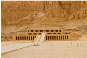
哈特普苏特女王神庙