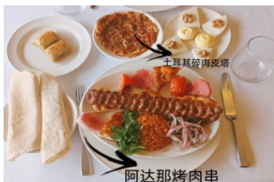
土耳其阿达那烤肉串