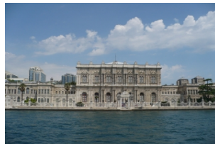
多玛巴赫切新皇宫