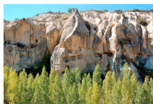
格雷梅露天博物馆