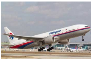
伊斯坦布尔阿塔图尔克机场 (机场代码IST)