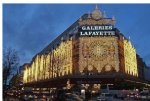
老佛爷百货公司 (奥斯曼旗舰店)