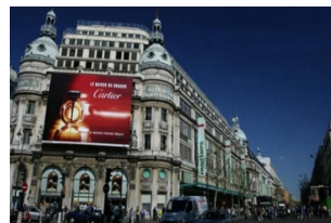
巴黎春天百货 (奥斯曼总店)