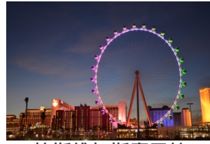
拉斯维加斯摩天轮