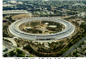
苹果飞船总部大楼