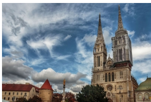
圣母升天大教堂（萨格勒布大教堂）