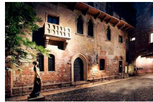
朱丽叶阳台与朱丽叶故居