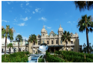
蒙特卡罗大赌场宫