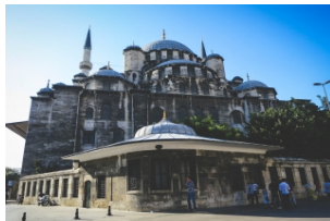
鲁斯坦帕夏清真寺