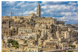
萨西民居和洞穴屋

酒店早餐后，游览历史悠久的马泰拉，参观罗曼式风格的【马泰拉主教座堂】，别具一格的【萨西民居和洞穴屋】。随后游览港口城市巴里，并前往被称为“天堂小镇”——阿尔贝罗贝洛，这里以‘楚利建筑’被熟知。踱步于阿尔贝罗贝洛的石子路间，一边感受淳朴的意大利小镇民风，一边欣赏古人用智慧堆砌出的艺术。晚上住奥斯图尼或其周边酒店。