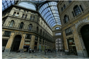
翁贝托一世拱廊街