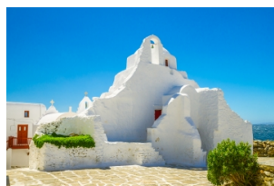
帕拉波尔蒂阿尼教堂