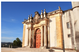
科英布拉大学巴洛克式图书馆