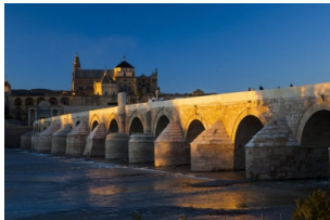
科尔多瓦古罗马桥