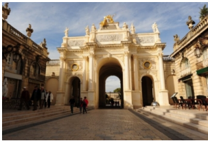
斯坦尼斯拉斯广场