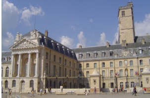
勃艮第公爵和政府宫殿