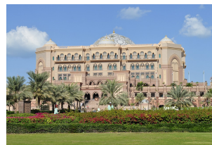
阿布扎比皇宫酒店