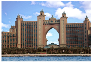
棕榈岛亚特兰蒂斯酒店