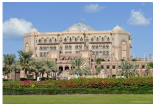
阿布扎比皇宫酒店