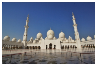
谢赫扎伊德清真寺