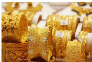
黄金市场和香料市场