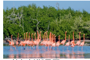
拉加托斯景区 (Ria Lagarto)