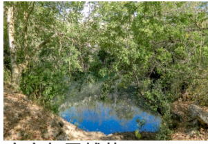
齐齐尔天然井 (Cenote Kikil)