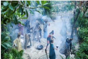
西卡莱特主题公园