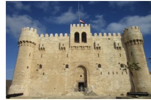
盖贝依城堡（灯塔遗址）