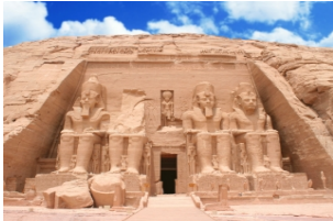
阿布辛贝大小神殿

上午您可以选择在游轮上好好地休息或是游玩阿斯旺城，我们更加推荐您自费参观埃及知名的【阿布辛贝大小神殿】。中午回到游轮上享受午餐和短暂休息之后，下午前往位于科翁坡市的【科翁坡神庙】，全埃及乃至整个世界至古老的一个日历图案就保存在神庙当中。