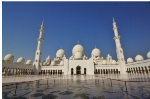
谢赫扎伊德清真寺