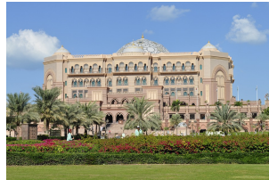
阿布扎比皇宫酒店