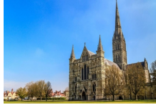
圣彼得和圣保罗大教堂