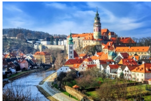
CK小镇--中世纪童话小镇

早餐后从酒店出发前往布杰约维采游览，亦称【百威小镇】。之后前往【克鲁姆洛夫】游览。克鲁姆洛夫，亦名“CK小镇”，名称源于德语“高低不平的草地”，这座美丽小镇坐落在伏尔塔瓦河上游，老城被马蹄形河湾环抱，保存了哥特式、文艺复兴和巴洛克风格的房屋。当晚入住萨尔茨堡或其周边酒店。