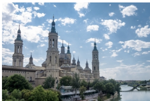
比拉尔圣母大教堂