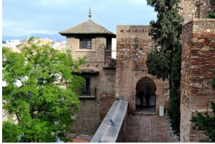
马拉加阿尔卡萨瓦城堡