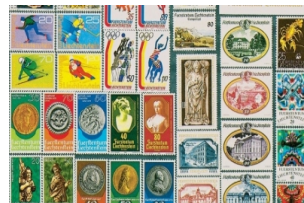
列支敦士登邮票博物馆