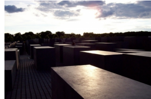
犹太人大屠杀纪念碑群