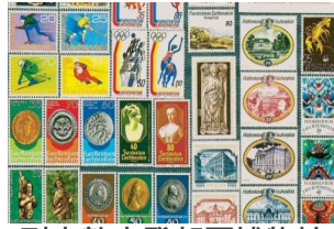
列支敦士登邮票博物馆