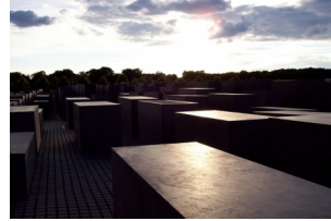
犹太人大屠杀纪念碑群