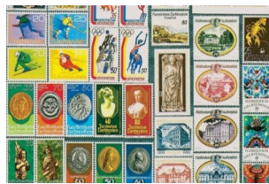
列支敦士登邮票博物馆