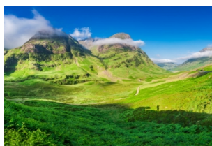
格伦科峡谷和三姐妹山