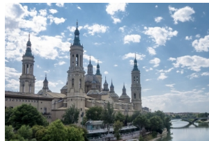
比拉尔圣母大教堂